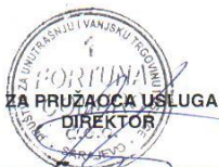
Filip Stanić, direktor

Ovaj ugovor sačinjen je u četiri /4/ primjeraka, od kojih Ugovorni organ zadržava tri / 3/ ,a Dobavljač jedan /1/ primjerak .